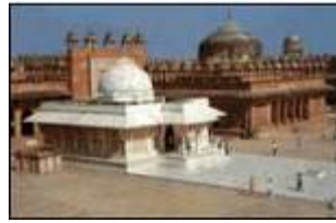
FATHEPUR SIKRI. d'Akbar. Abandonnée véritable cité- découvrir privées, le " Panch Impériale, les Palais