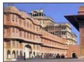
Rajpoute et Moghol, d'astronomie et