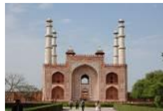
originales, d'où portes de grès rouges est Hindoue, la permet d'étudier au Taj Mahal .